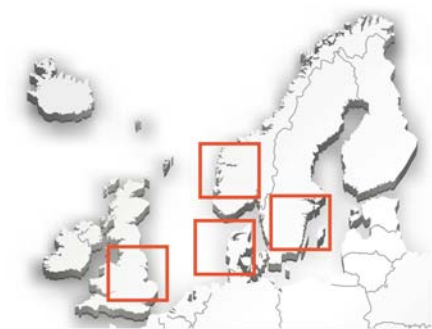
ColdZyme säljs för närvarande i Skandinavien och i Storbritannien.

Enzymatica grundades 2007, har säte i Lund och är sedan den 15 juni 2015 noterat på Nasdaq First North.